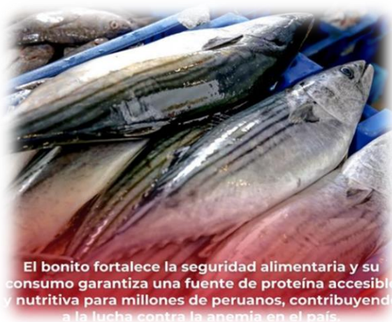
El bonito fortalece la seguridad alimentaria y su consumo garantiza una fuente de proteína accesible y nutritiva para millones de peruanos, contribuyendo a la lucha contra la anemia en el país.